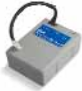
PS124 batería 24V con cargador de baterías integrado