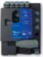
RBA2 central de recambio, para RBKCE