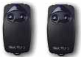
FL02R-S 2 transmisor 433.92MHz de 2 canales