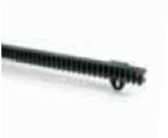
L05 cremallera 26x26x500mm en material plástico, para puertas de hasta 400kg