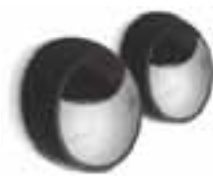
MOFB 1 par de fotocélulas para montaje de superficie para la conexión por Nice BlueBUS