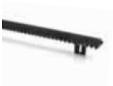
ROA6 cremallera M4 25x20x1000mm con agujeros alargados de nylon con inserción metálica