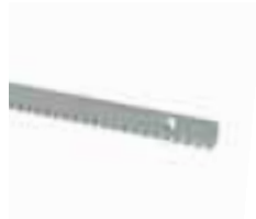
ROA8 cremallera M4 30x8x1000mm galvanizada, con tornillos y distanciadores