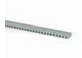
ROA7 4 metros de cremallera acero galvanizado en barras de un metro, 22 X 22 mm