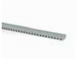
ROA7 cremallera M4 22x22x1000mm galvanizada