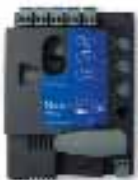
RBA2 central de recambio, para RBKCE