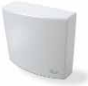
A01 central de mando Uds./paquete 1