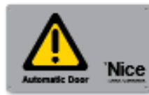
TS placa de señalización Uds./paquete 1