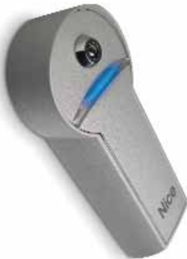
KIO selector de llave con mecanismo de desbloqueo por tirador con cable metálico Uds./paquete 1

Por exigencias de almacenamiento, envío y uniformidad de los paquetes, se aconseja pedir el producto en paletas. A tal fin se ha indicado la cantidad de paquetes por cada paleta.